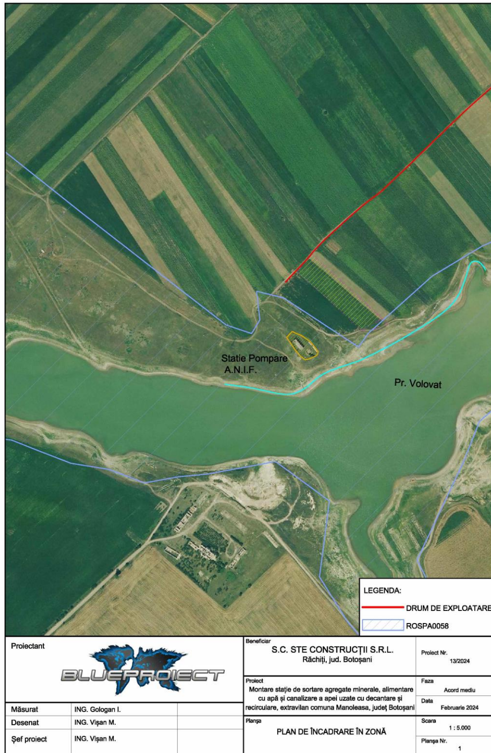
Figura 1. Plan de incadrare