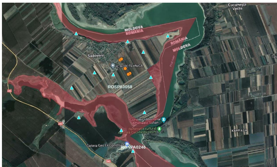
Figure 5. Amplasamente puncte monitorizare in coordonate GIS – Stereo 70 conform tabelului de mai sus