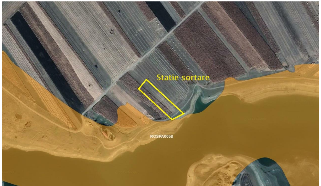
Figure 3. Amplasarea conform coordonatelor Stereo 70